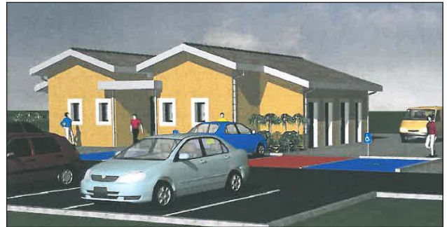
Une image de ce que sera la Maison de santé communale dont la construction est prévue sur l'Esplanade Fongrave.

Peu avant elle avait soumis un dossier à M. le Sous-préfet en décembre dernier pour la dotation d'équipements des territoires ruraux (DETR) dans le but d'obtenir une subvention d'environ 50 000 euros.