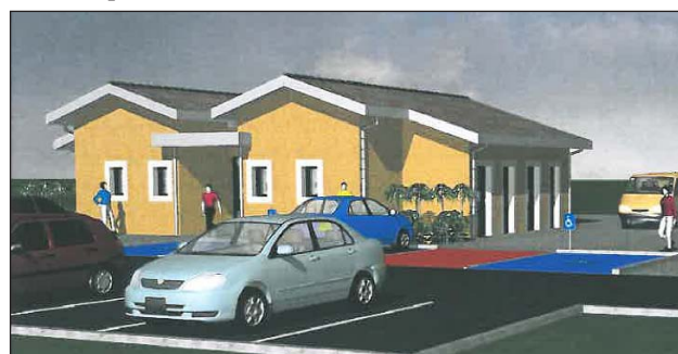
Une image de ce que sera la Maison de santé communale dont la construction est prévue sur l'Esplanade Fongrave.

Peu avant elle avait soumis un dossier à M. le Sous-préfet en décembre dernier pour la dotation d'équipements des territoires ruraux (DETR) dans le but d'obtenir une subvention d'environ 50 000 euros.